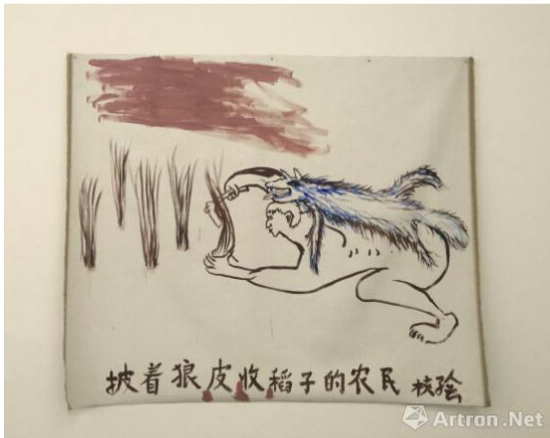
《披着狼皮收稻子的农民》 廖国核