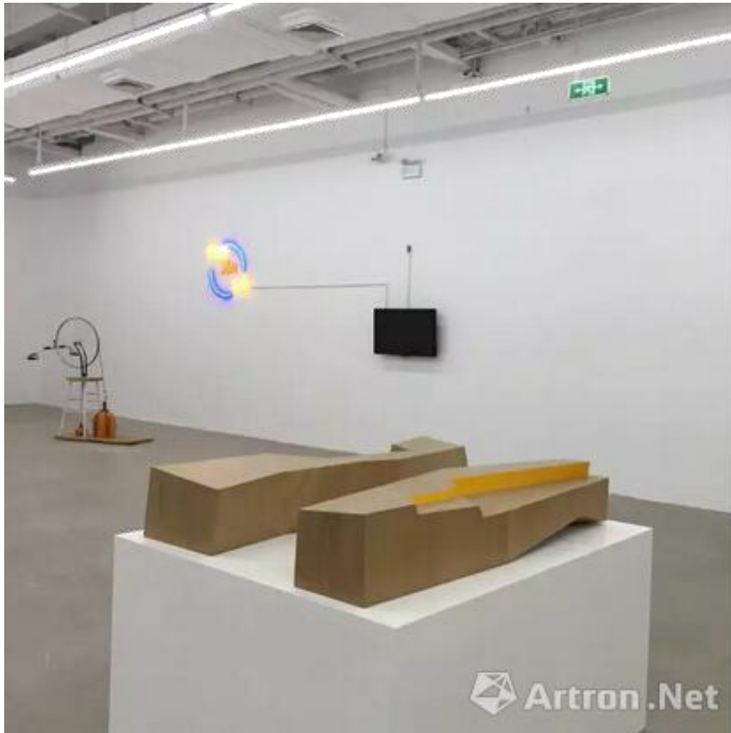
汪建伟，《条件 No. 14》、《条件 No. 15》