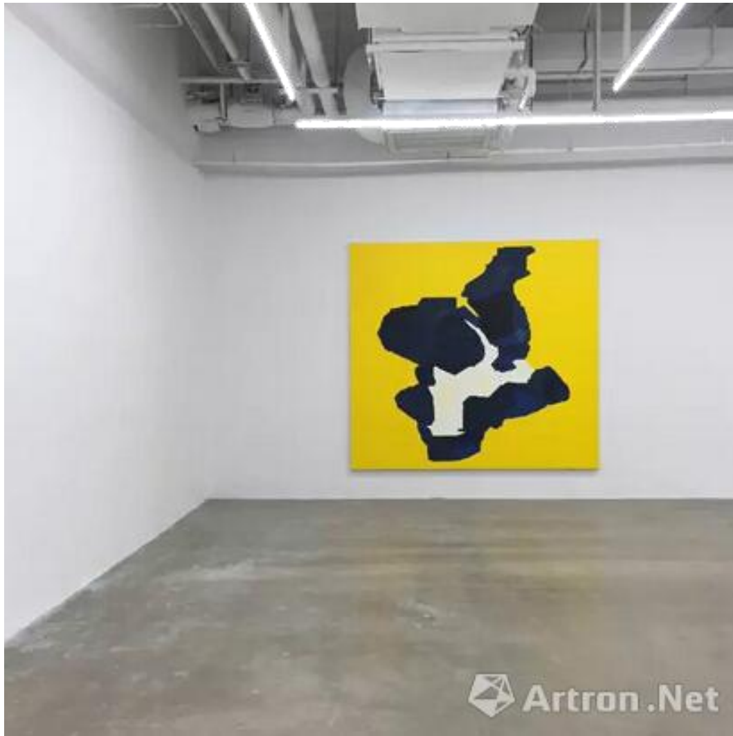
汪建伟，《表面 No.2》，展览现场，摄于剩余空间，武汉，2015