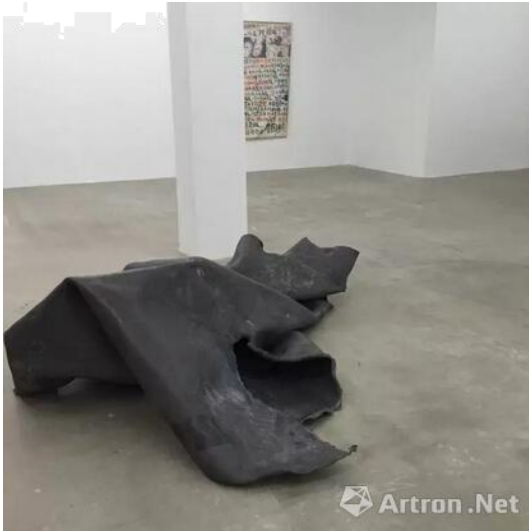
《深渊》铅，180 x 150 x 110 cm，2014

王思顺展出的作品名为《深渊》，将一块铅穿透挂在墙上，它承受不了自己的重量，某个时间撕裂自己从墙上坠落。